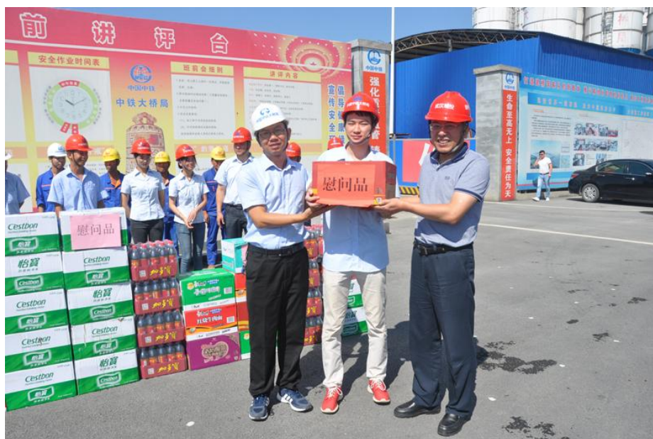
鲁有月董事长带队慰问